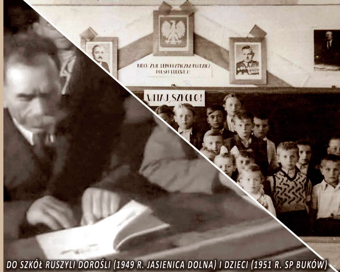
DO SZKÓŁ RUSZYLI DOROŚLI (1949 R. JASIEŃCA DOLNA) I DZIECI (1951 R. SP BUKÓW)

UCZYĆ SIĘ, JAK NAJWYTRWALEJ TO NASZE OBECNE ZADANIE